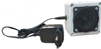
Hálózati adapter és rágcsálóriasztó

Az optimális elhelyezés az adott nyílással (ahonnan be tudnak jönni a kártevők) ellentétesen (szemben) található helyen van. Pl. ajtóval szemben levő falsík mentén, ajtó felé irányítva.