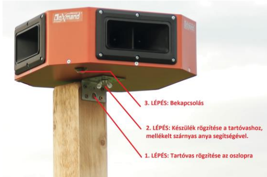
Rögzítés és bekapcsolás